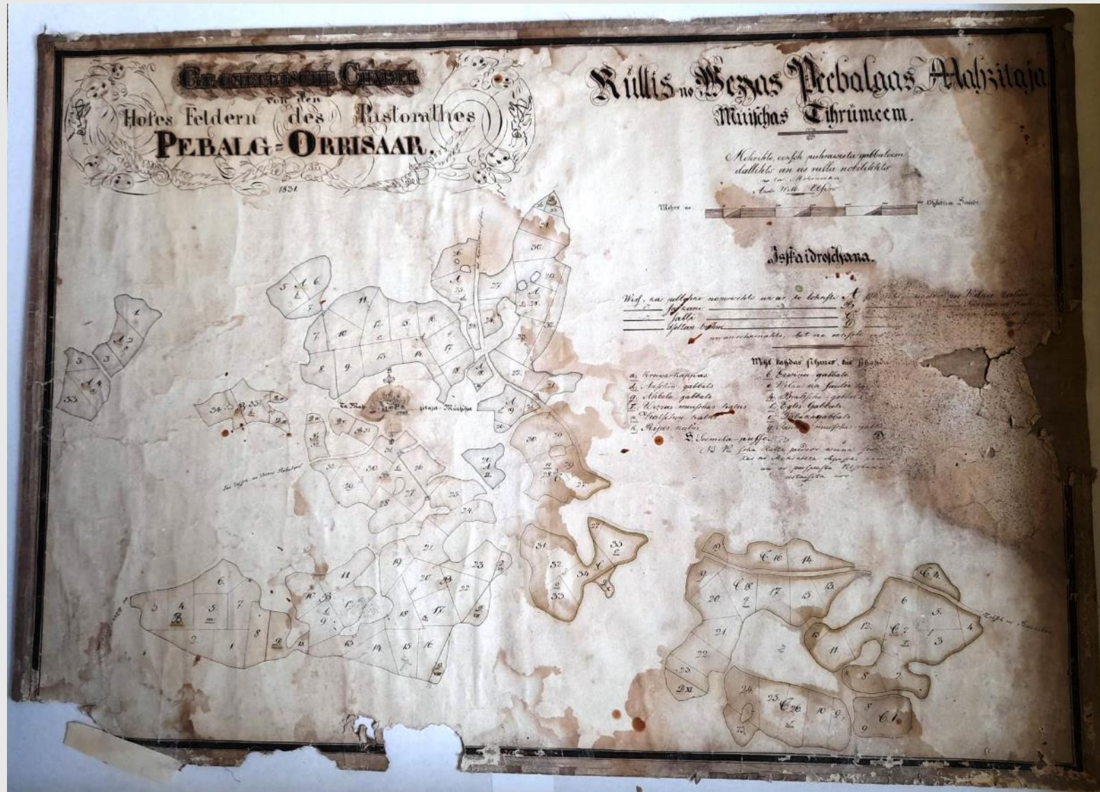
Piebalgas muzeju apvienības "Orisāre" krājums, ORIS 1885