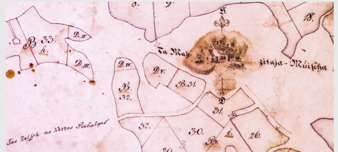
ORIS 1885